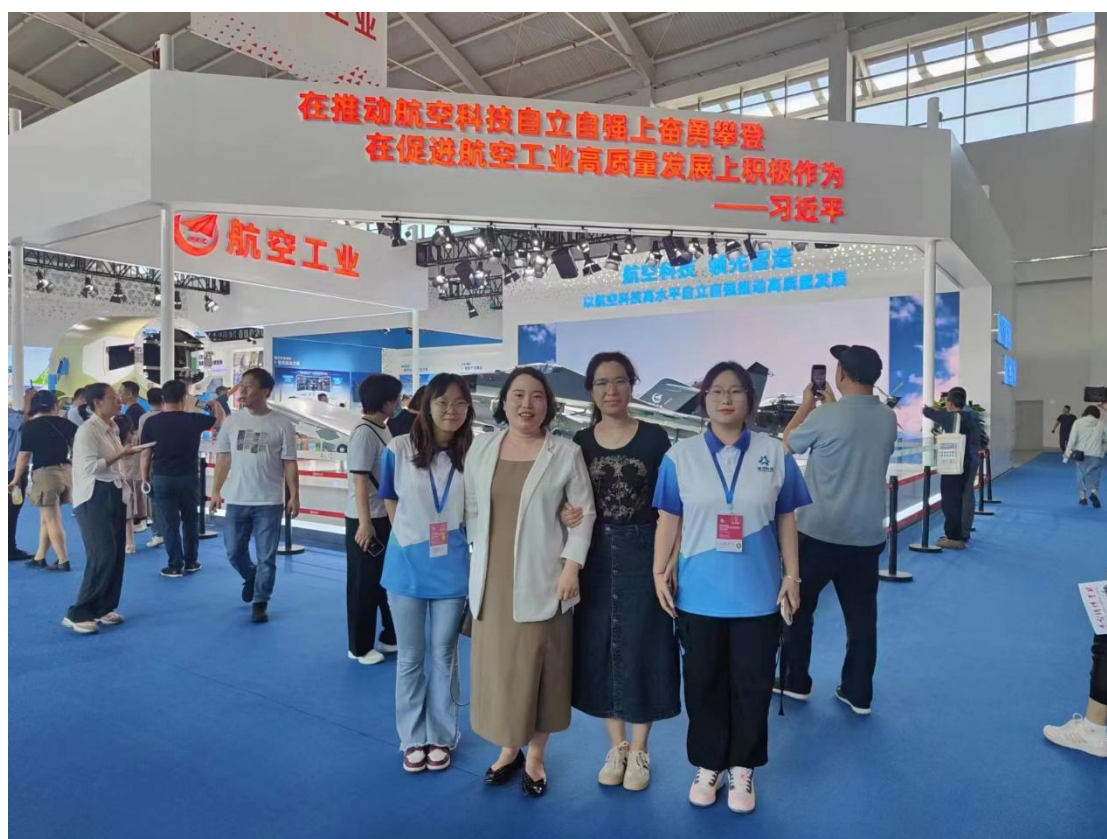
图为 2023 年 9 月教师到展会现场考察实践合影

场管理和展后评估等工作，为我公司提供了新的理念和发展动能。同时，公司骨干每年到学校开展企业宣讲、制博会办展经验分享、行业前沿报告等交流活动，为打造“双师型”教师团队打下了坚实基础。