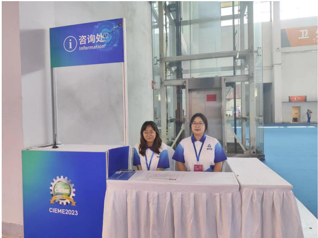
图为 2023 年 9 月学生在中国制博会现场实训照片