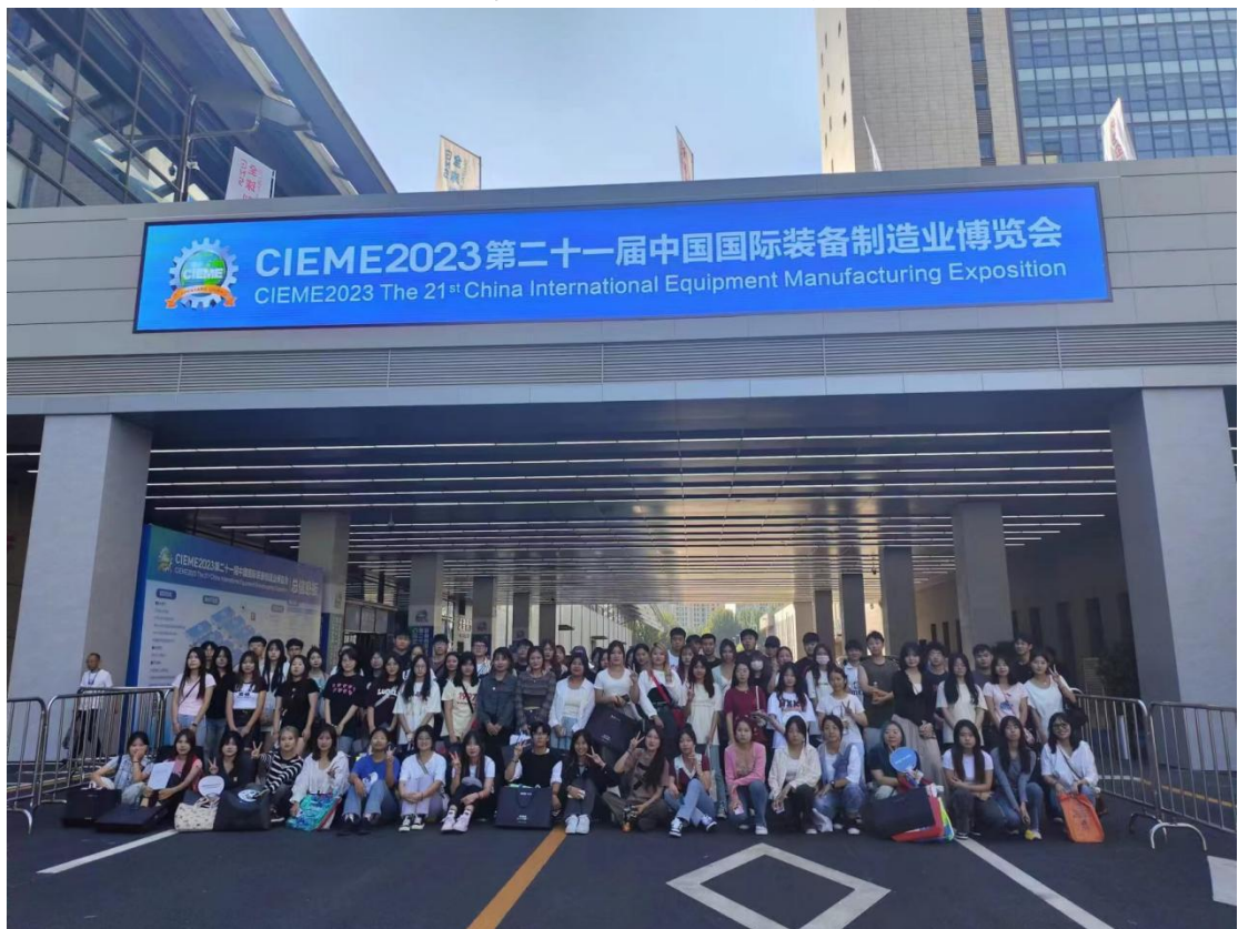
图为 2023 年 9 月学生在中国制博会现场实习实训合影