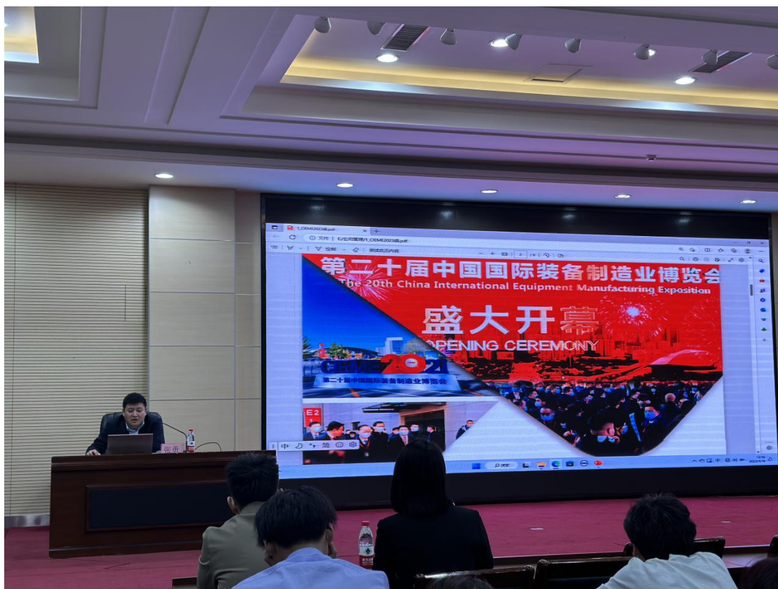
图为 2023 年 4 月企业专家代表到校召开金诺订单班学员选拔交流会照片