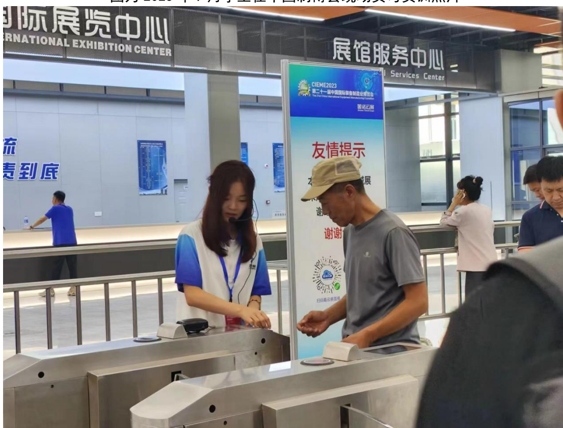
图为 2023 年 9 月学生在中国制博会现场实习实训照片